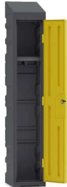
Casier vestiaire qualité alimentaire avec une étagère tringle