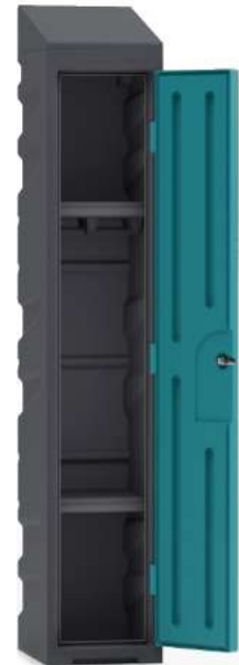
Casier vestiaire avec une étagère tringle et une étagère simple