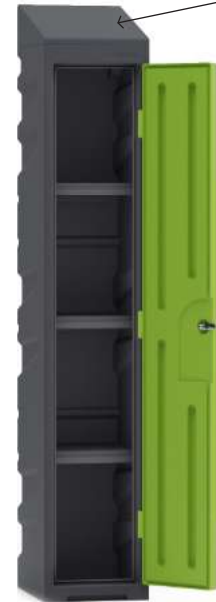
Casier vestiaire qualité alimentaire avec 3 étagères simples