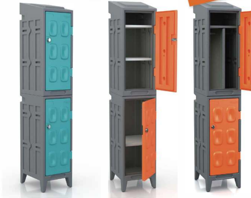
Demi vestiaire avec étagère tringle ou simple.