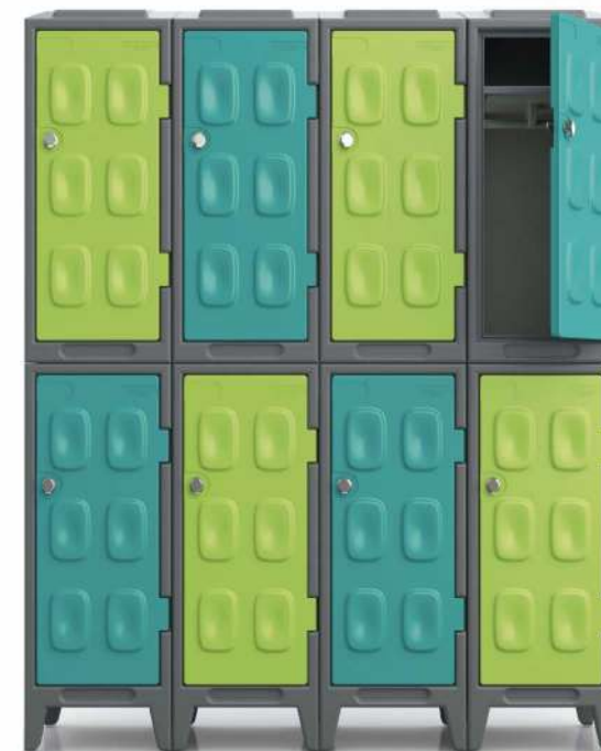
Possibilité de mélanger les couleurs (choix de 7 couleurs). Livré avec une serrure cadénassable